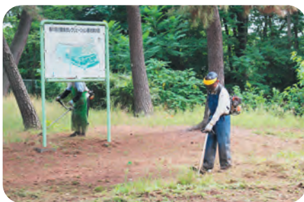
シルバー人材センターでは会員を募集しています。