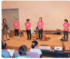
夏休み介助犬講座の様子

社協の活動をご理解いただき、ひとりでも多くの町民の皆様の社協会員加入へのご協力をお願いいたします。