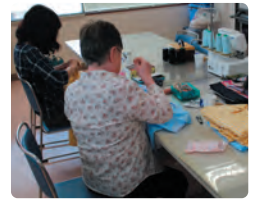
ボランティアで改良ねまきの製作中です