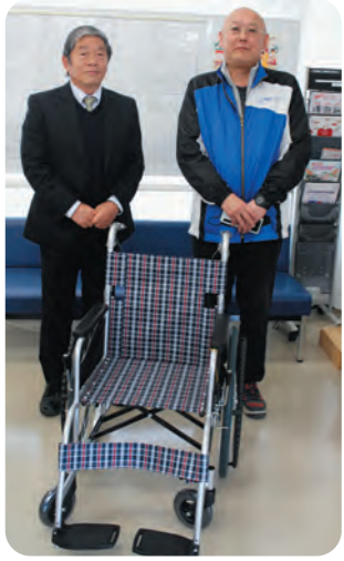
雪印メグミルク北関東協会様より、車いすを寄贈していただきました。