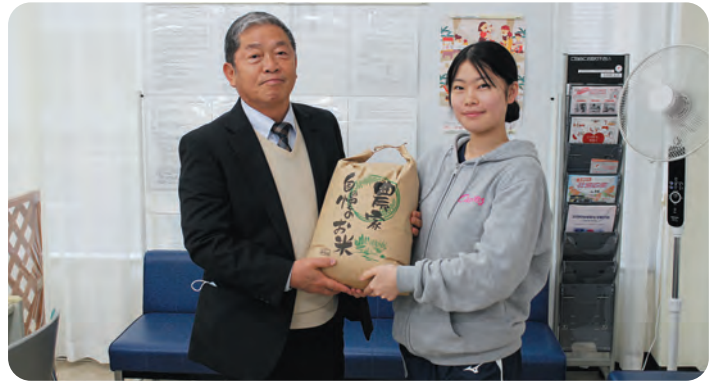
カーブス藤岡中央様から食料品をご寄附いただきました。