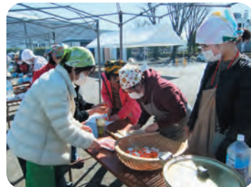
災害時における炊き出し訓練 (ボランティアセンター、 ボランティア連絡協議会)