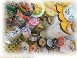
～子ども食堂のみなさん～